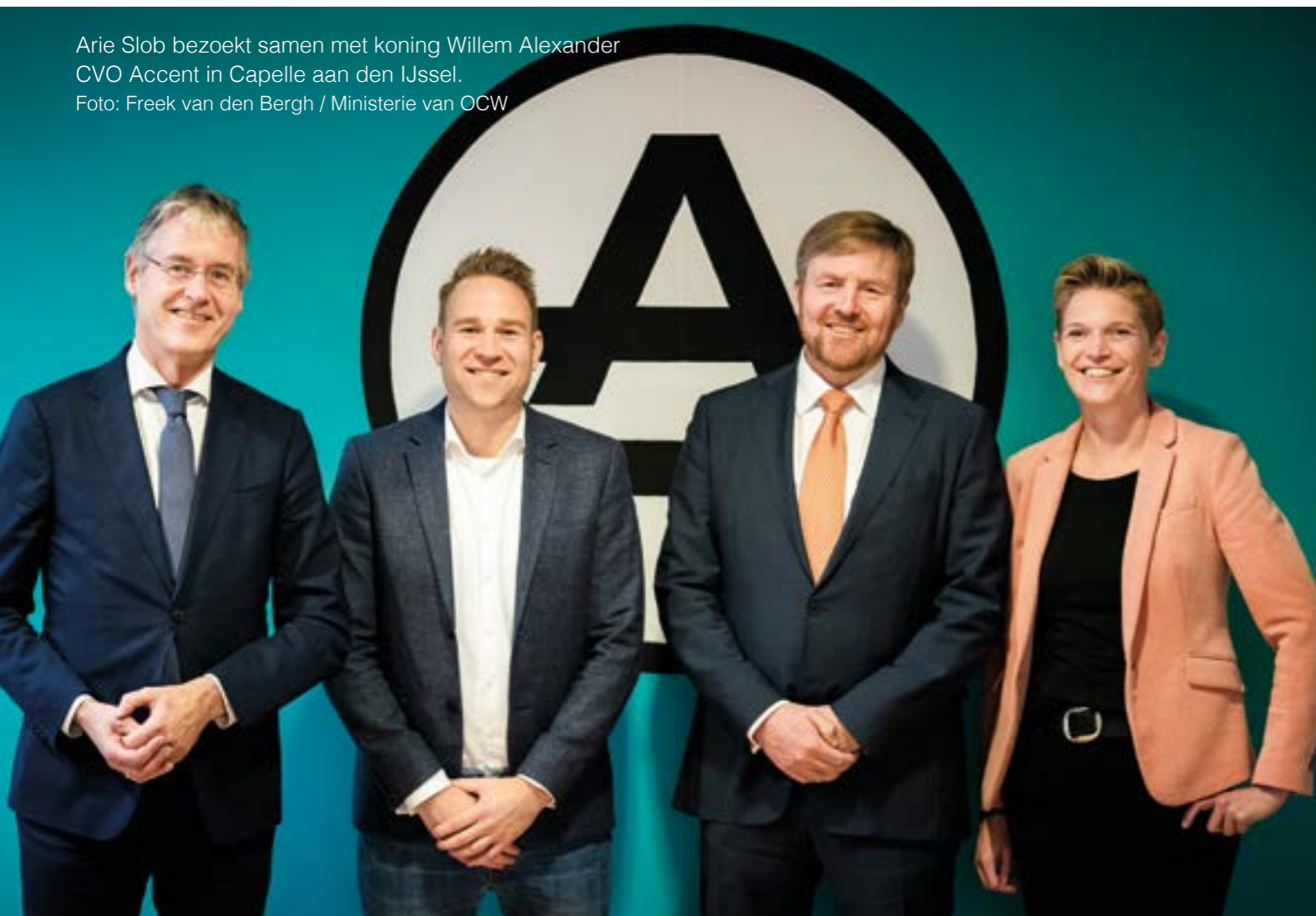
Arie Slob bezoekt samen met koning Willem Alexander CVO Accent in Capelle aan den IJssel.

Arie Slob (1961, CU) was van oktober 2017 tot en met januari 2022 minister voor Basis- en Voortgezet Onderwijs. Hij is nu 'verbinder en boegbeeld' voor de Regio Zwolle en voorzitter van twee raden van toezicht: van de gereformeerde scholengemeenschap Greijdanus en van Trias Jeugdhulp. Daarnaast heeft hij een adviesbureau.