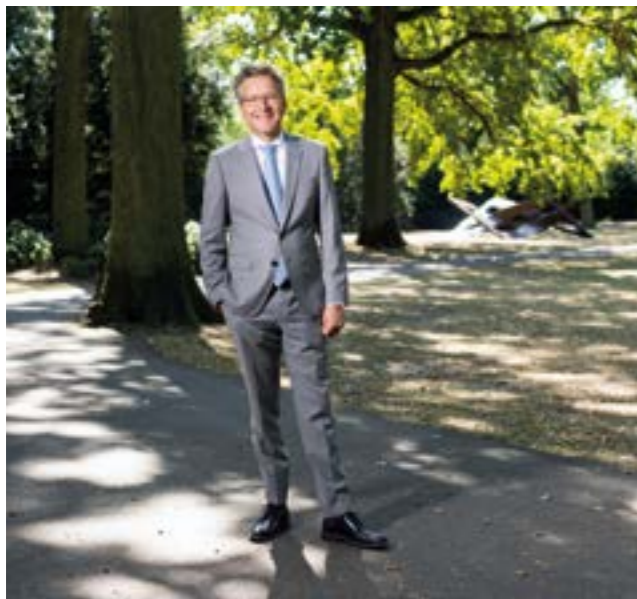
Jeroen Dijsselbloem

'Zijn' Commissie Dijsselbloem blikte onder andere terug op de invoering van de leerwegen in het vmbo, waarbij het praktijkonderwijs is ontstaan. Hij is daarna andere dingen gaan doen, maar voelt zich nog steeds betrokken bij het onderwijs. Zo vindt Jeroen Dijsselbloem dat de overheid de onderwijskwaliteit veel actiever moet bewaken en moet zorgen dat het stelsel goed uitpakt voor leerlingen, ook bij de overstap van praktijkonderwijs naar mbo. Hij vindt dat de potentie van leerlingen vaak onvoldoende wordt gezien, én pleit voor veel betere salarissen voor mensen die zwaar werk doen. 'Als schoonmakers of vakkenvullers twee weken niet komen, hebben we een groot probleem.'